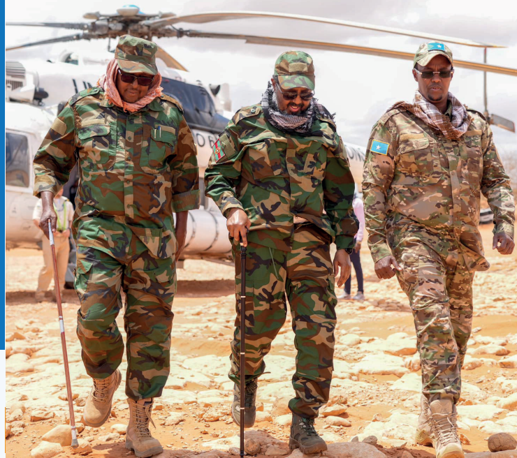
Madaxweyne Dr. Sheekh oo Dardargelinta Ladagaalka Khawaarijta u tagay Maxaas iyo Aadan Yabaal