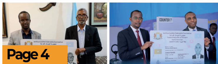
Hoggaanka Dowladda Federaalka ah oo Qaatay Kaarka Aqoonsiga Qaranka